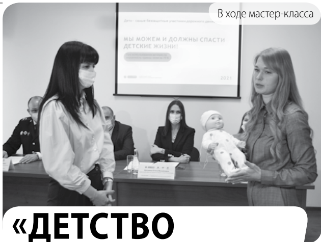
В ходе мастер-класса